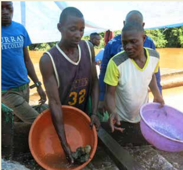
沙布达镇乌林迪河上的手工采金者。

“这是他们[从乌林迪河]开采的黄金。[出示黄金]这里是6克。这些黄金像沙子一样。这是一天的工作所得。这是我的薪水。这是[我从河里淘出的黄金的]20%，6克黄金。我花了一天——10小时[采出那些黄金]。我[总共]生产了30克金。所以，他们给我6克。