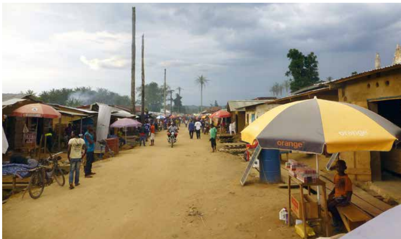
沙布达镇，南基伍省。