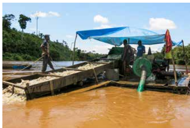
在淘金热最鼎盛的时期，最多有150艘人工操作的采金船(如照片中所示)沿乌林迪河进行采金作业。