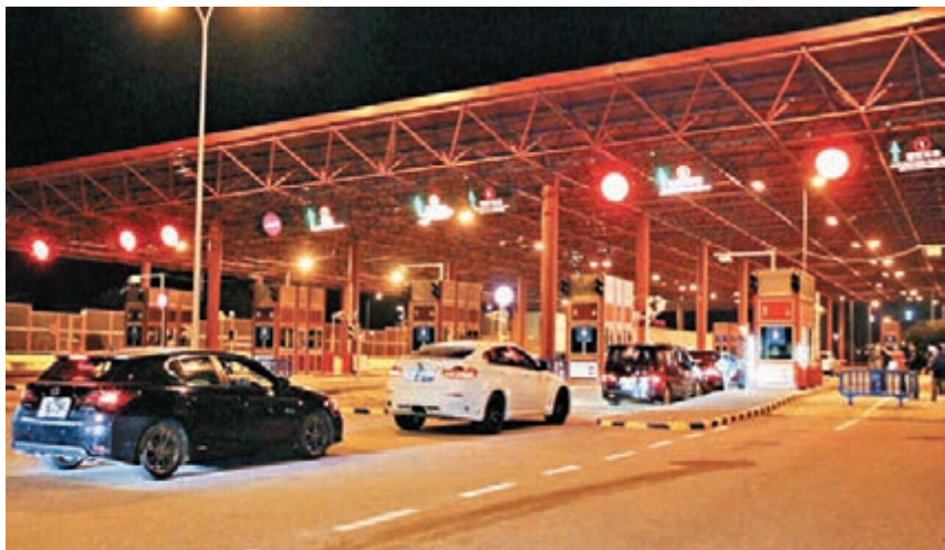
■下周二起,首批澳門單牌車可自由出入橫琴,並享受「一站式」驗放系統以快速通關。圖為汽車正在過關。

海關以「單一窗口」的形式受理備案申請,拱北海關監管處處長麥鴻毅介紹說,申請人在申請時通過「單一窗口」形式向地方政府主管部門一次提交申請材料即可,無須申請人專門到海關窗口遞交申請材料。海關通過跨部門互連的信息系統平台,在線完成海關備案手續;申請人收到系統反饋的通知後,即可於橫琴口岸入境報關樓一樓大廳海關