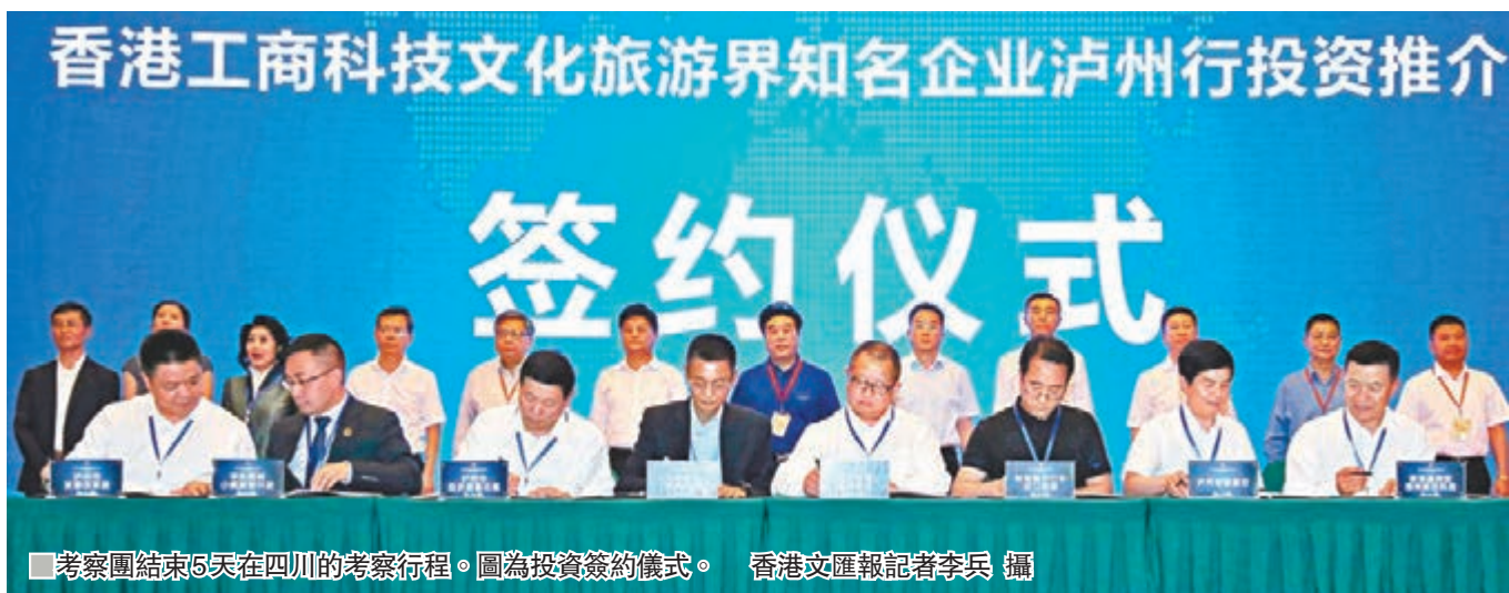
考察團結束5天在四川的考察行程。圖為投資簽約儀式。

港科技產業園」……截至目前,有港資企業19家落戶瀘州,主要分佈在化工、能源、醫藥、房地產、服務業等領域。