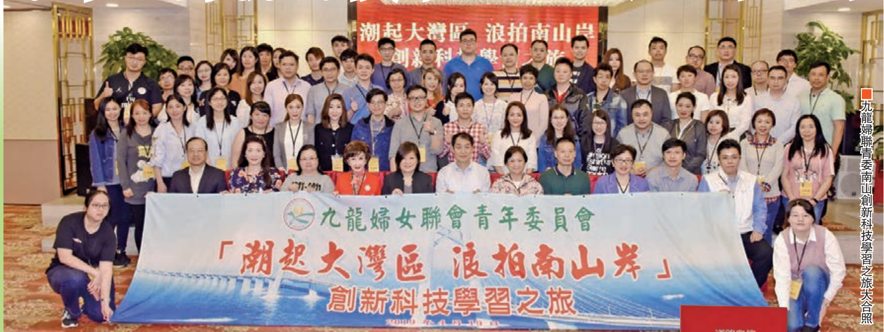
九龍婦女聯會南山創新科技學習之旅大合照

由九龍婦女聯會青年委員會主辦的「潮起大灣區 浪拍南山岸」創新科技學習之旅(下稱「創科之旅」)於4月19日圓滿舉行,來自金融、醫療、工程、物流航運及社會工作等行業的青年近80人,參觀了位於深圳南山區的多家創新及科技機構與企業,並分享交流。