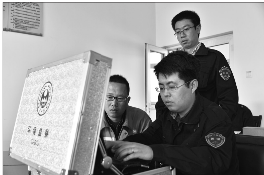
天津市环境监察总队配备了搭载地理信息系统的环境监察移动执法设备,实现了现场执法、任务派发、案件管理、绩效考核、资源检索等多种业务功能的集成,提高了环境执法效率。图为天津市环境监察总队执法人员使用移动执法设备开展现场执法检查。

天津市环境监察总队不断加大执法力度、开展专项检查过程中,实现了执法方式4个转变:由点源监管向点面结合转变、由方法单一向灵活多样转变、由被动处理向积极防范转变、由单打独斗向联合执法转变。