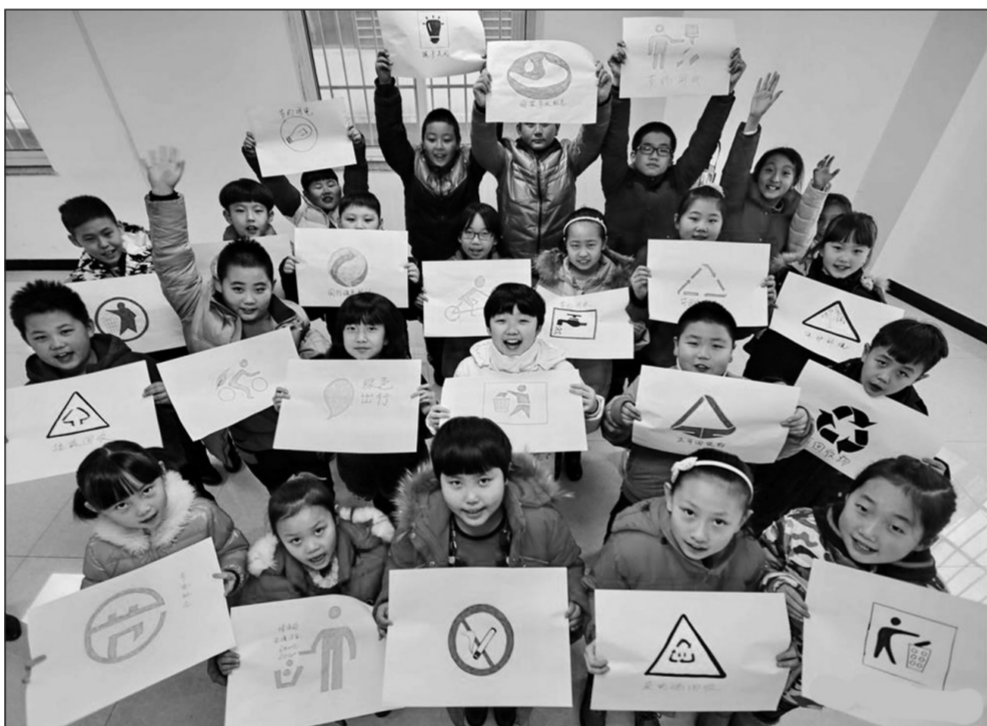
河北省秦皇岛市海港区东方明珠城第二社区近日开展“手绘环保标识”主题活动。社区小朋友在工作人员的带领下共同认识、绘画环保标识,并在绘画的过程中学习环保知识,树立节约资源、节能减排的意识。