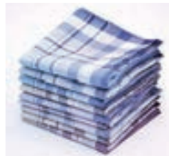
過去手帕可作定情物 and 禮物。