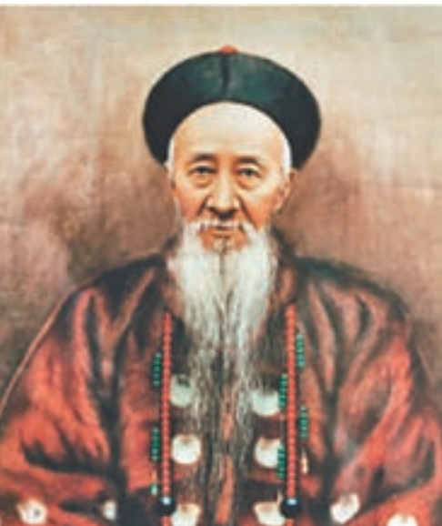
張之洞開創了動用行政權力干預語言文字的網上圖片