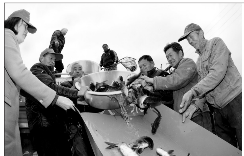
四川省广元市水务局近日在嘉陵江广元城区段、利州区白龙湖放流鱼苗210万尾。至此,广元市今年已向嘉陵江流域水系放生1200万尾鱼苗,改善了当地的渔业资源和水生生态环境。

良好的投资环境得到了众多投资企业的青睐。据悉,今年前10个月,南宫市共签约46个项目,核心投资151.4亿元,其中超亿元项目有31个。目前已有29个项目履约,履约率为63%。在数量、质量和履约率上均创历史新高。