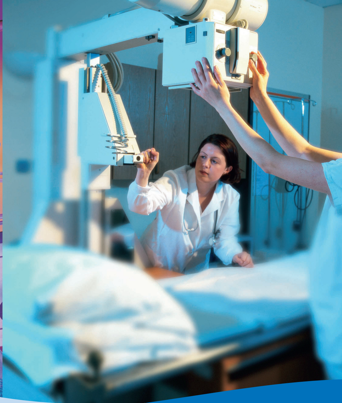
Condair PS 干蒸汽加湿器系统