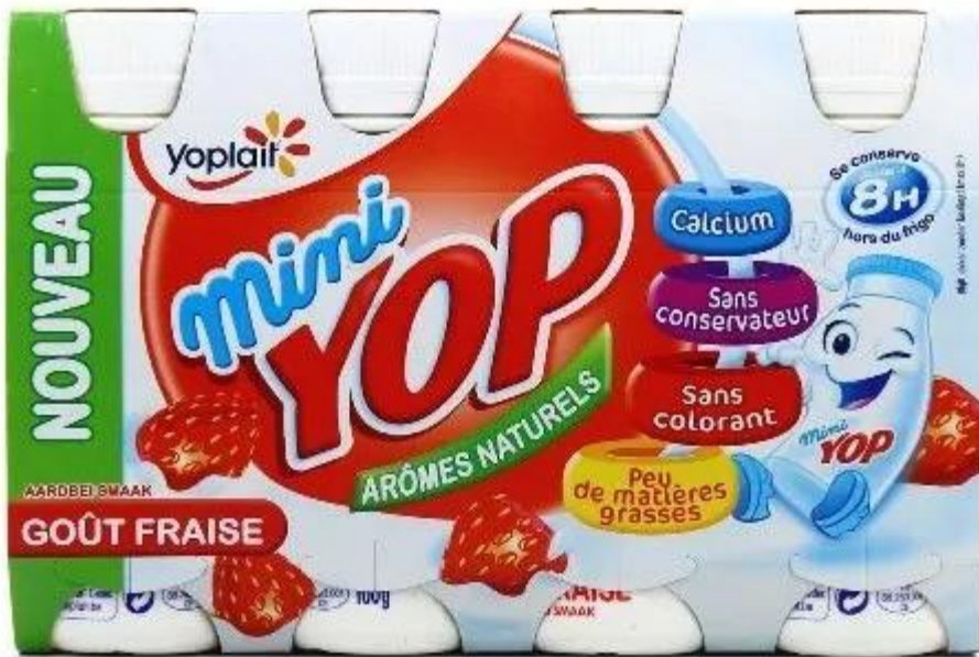
欧洲食品厂商经常用“低脂”吸引消费者。

某些品牌将食品高含量营养物质、或优势效果强化宣传的做法很常见，比如“富含钙”，“减少 70%脂肪含量”。还有一些品牌强调食品对身体的影响，比如在“健康说明”介绍产品中含有的维生素 C 可以“增强抵抗力”，“强化免疫系统”等。