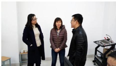
教研员与老师讨论授课效果