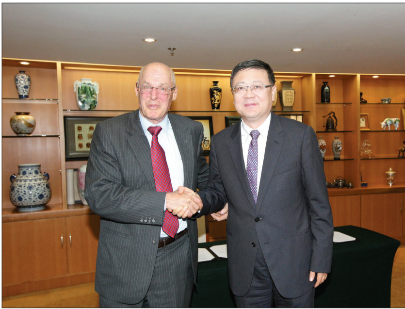
6月16日,环境保护部部长陈吉宁在京会见美国前财长、保尔森基金会主席亨利·保尔森,双方就环境保护合作问题进行交谈。

本报记者王昆婷 6月16日北京报道 环境保护部部长陈吉宁今日在京会见美国前财长、保尔森基金会主席亨利·保尔森,双方就共同关心的环保问