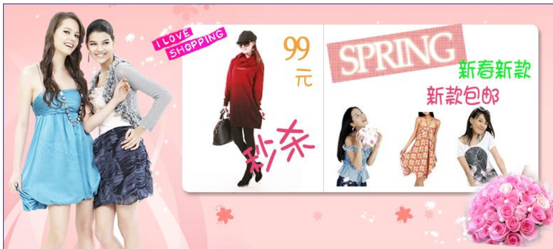
图 1:网店促销区域的制作效果图

“佳 X 元”是某城市一家专门销售女式时装的服装店，为了拓展客户市场，“佳 X 元”在淘宝开店来进行网上销售。请根据素材文件夹下提供的素材为其网店进行促销区域的制作和美化。网店促销区域的制作效果如下图所示: