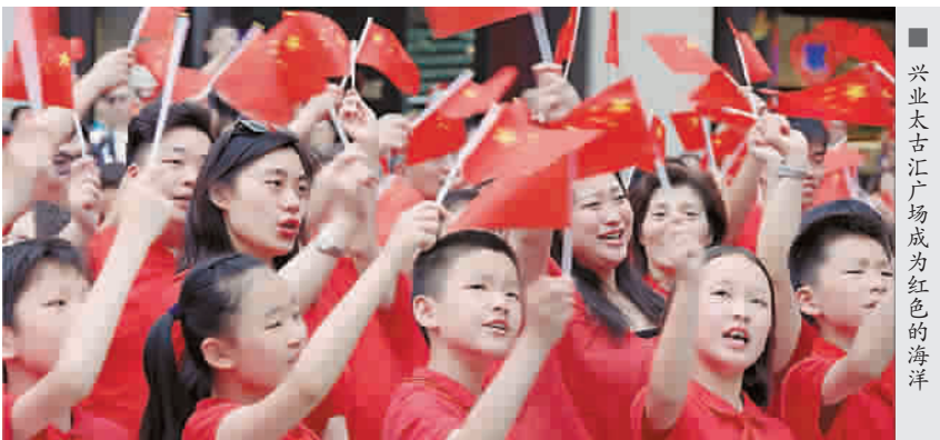
兴业太古汇广场成为红色的海洋

鼓点中跃动而出,与兴业太古汇广场的活动呼应,仿佛一场跨越时空的对话,歌声渐入高潮,人们惊喜地发现,广场上寓意着新中国走过70年光辉历程的70只麦克风前,站满了穿着红衣的快闪参与者,他们构成了一幅巨大的五星红旗。震撼的场景、激动人心的音乐,点燃了在场所有人的情感。