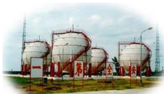
长流液化石油气储罐

经过几年的开发建设,公司在城市燃气经营和燃气工程开发方面已取得了较为可喜的成绩。截止99年,公司在海口管道燃气工程方面的投资已达到3亿多元,海口市煤气工程主体部分已基本完成,已建成两座气源厂,敷设燃气管网140多公里,覆盖海口市面积达80%以上。此外,配套的长流油气基地亦已进入全面施工阶段,液化气储存站首期工程已建成并投入使用。以上工程的建成弥补了海口市在城市管道燃气基础设施及配套工程上的多项空白,极大地改善了海口市城市能源结构。