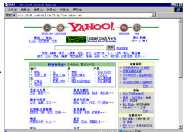
通过 Readworld 浏览的 Yahoo 主页