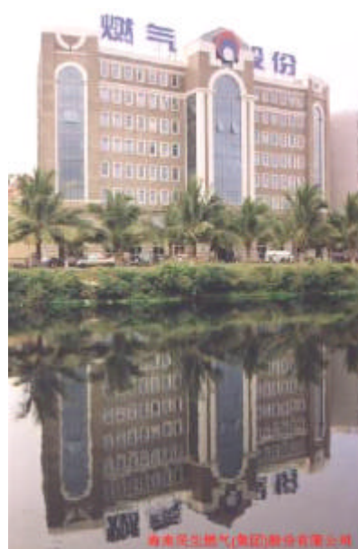
海南民生燃气(集团)股份有限公司