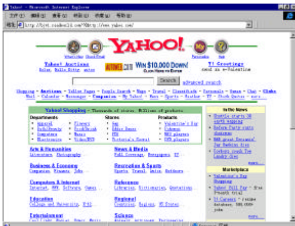
直接浏览的 Yahoo 主页