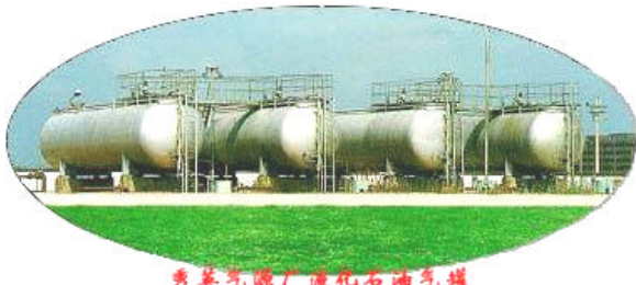
秀英气源厂液化石油气罐

作为上市公司的燃气企业，由于其特有的行业特性，决定了公司在发展过程中，既要考虑到保持国有燃气企业的基本属性，又要考虑到企业的自身发展及对社会、对股东应尽的责任。因此，企业必须建立适合市场竞争的新的经营管理体系，充分利用行业优势，