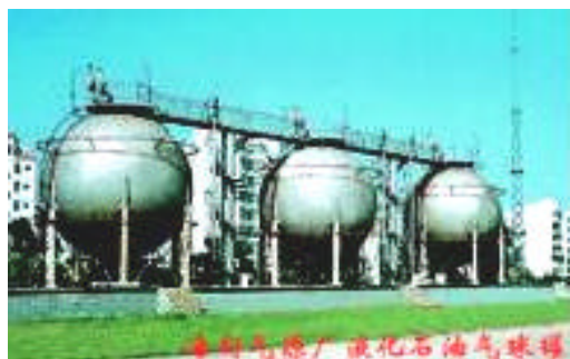
海口气源厂液化石油气储罐

本公司主要从事城市能源供应和城市基础设施建设,主营业务是城市管道燃气工程建设和燃气供应。公司自创立以来,在国内大多数燃气企业出现政策性亏损,需要大量财政补贴的情况下,公司按照《公司法》的规定建立现代企业制度,借助股份制灵活有效的经营管理机制,自筹资金,边建设边经营,经济效益呈逐年递增的趋势,在国内同行中名列前茅,成为海南纳税大户。