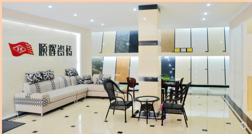
①顺辉瓷砖展厅一角 ②富得利地板展厅一角 ③宏浪卫浴展厅一角 ④顺辉瓷砖展厅一角

1.顺辉瓷砖是响当当的大品牌。荣获中国瓷砖十大品牌、中国驰名商标、广东省著名商标、广东省名牌产品等称号。央视热播，CBA联赛官方指定产品，在社会上享有“中国瓷砖看佛山，佛山瓷砖看顺辉”的美誉。2.顺辉瓷砖质量十分稳定。“瓷片之王、抛光砖之王”就是顺辉瓷砖的代名词，其公司在生产过程中，采用的都是国内外最先进的技术与设备，拥有自己的产品研发中心。我们经销顺辉瓷砖10年，在近万户消费者中，未发现不合格产品和工程质量问题。3.顺辉瓷砖具有抗菌作用。能够大肠杆菌、金黄色葡萄球菌等常见细菌具有一定的杀灭作用，同时具有防霉、净化空气以及红外效应等功能，率先获得国家专利。4.顺辉瓷砖价格靠谱。凭借其产品质量和价格占