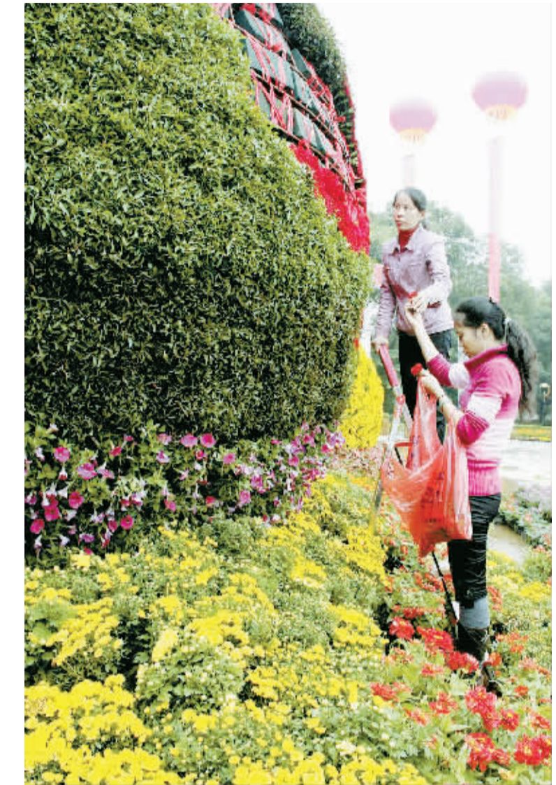
25日以来,邵阳市城区“穿红着绿”,不仅在主街道上悬挂国旗,还将12万盆鲜花摆放在街道、公园、广场等地,营造欢乐、祥和的国庆氛围。

2009年,帅光明荣获全国“百名军旅华商奖”和湖南省第二届“新农村建设十大杰出人物”。