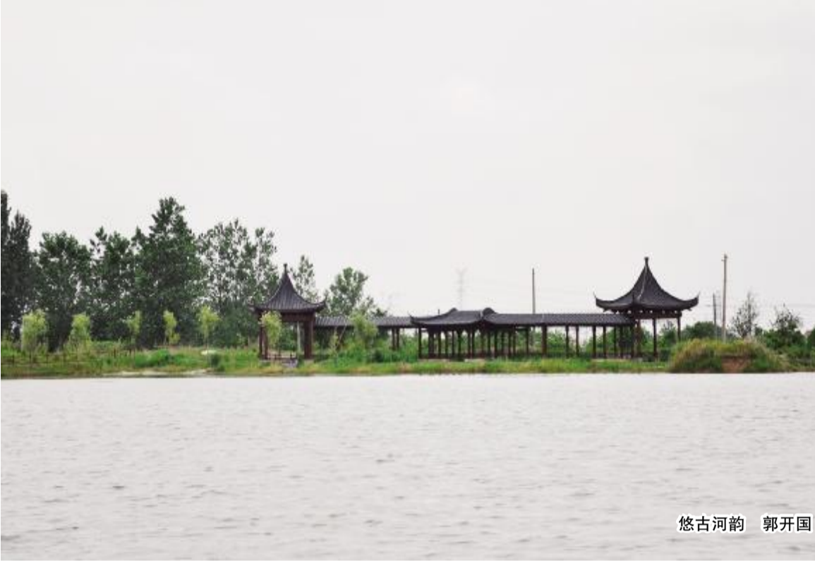
悠古河韵

李志勇 易事，只有经常与涂沟打交道的娴熟的勾蛭人，才能一眼瞅出哪是蛭的窟。这时，他只需把蛭勾子(一种似毒蛇两颗毒牙的勾蛭专用工具，一般身手的铁匠根本不会打造)顺着蛭眼子伸进窟里，待有硬碰硬的响声传出，即转动蛭勾子轻轻地向外一拽，一只“嗤嗤”冒着胃水的肥蛭即手到擒来。 挖蛤蜊不是在涂沟里，而是在涂面上。挖蛤蜊挖蛤蜊，因为是挖，所以它需要一把锹。这锹同农家挖田的锹既相同又不同。相同的是它们同样是窝口，不同的是，挖田的锹窝口大，而挖蛤蜊的锹窝口小、小得只有成年人的半拃。蛤蜊把自己的身子埋在涂地里，如何发现它是挖蛤人首先面临的一道考题。有经验的挖蛭人，看似不经意地走在涂地上，但大脑却似一部高速运转的计算机在仔细地辨