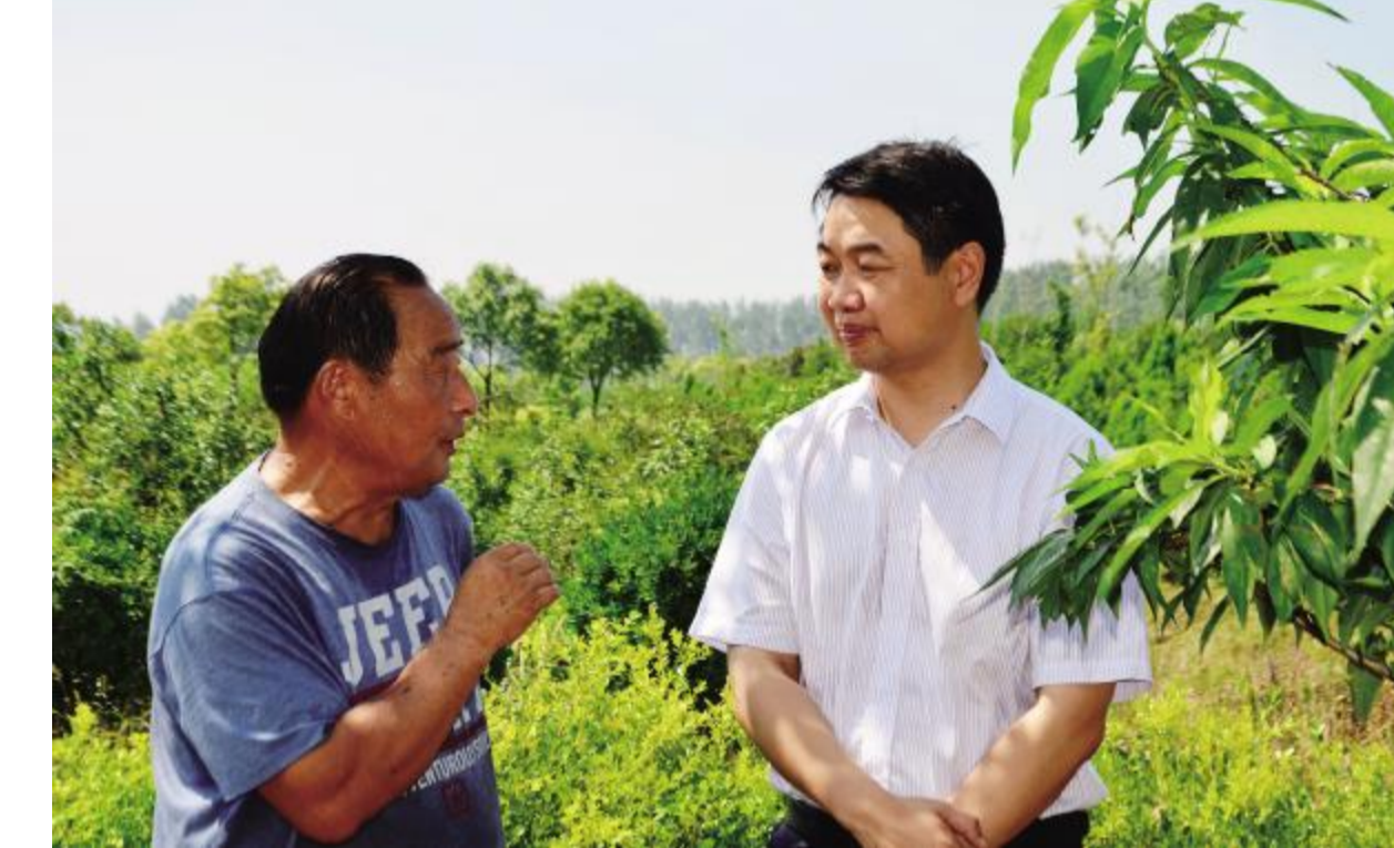
射阳农商银行千秋支行积极做好扶贫贷款发放工作,到7月末共发放扶贫贷款170多万元。图为该行负责人在农户田间调研时的情景。

本报讯(通讯员 吴廷彬)8月3日上午,长荡镇特邀市人民检察院职务犯罪预防处处长徐英子到该镇开展预防职务犯罪警示教育专题讲座。该镇机关全体工作人员、各单位(部门)负责人、村(居)三大员共110余人聆听了讲座。这是该镇落实县委十四届三次全会精神,全面推进从严治党的扎实举措。 为深化“三严三实”教育,切实把县委全会全面推进从严治党的精神落到实处,该镇结合市检察院检察长戴飞到甲侯村开展“三解三促”时的指示精神,切实加强基层党组织反腐倡廉建设,着力培养对党忠诚、个人干净、敢于担当、发展上有脑筋、维稳上有能力、团结上智慧的基层干部队伍。 专题讲座中,徐英子以清廉传统、造福百姓为主题,围绕当前反腐形势、全市村干部职务犯罪情况、对职务犯罪的认识误区以及预防职务犯罪的对策等四个方面,结合大量的案例、实例,从不同的角度进行了深邃的分析与充分的阐述,给该镇全体与会人员深刻的启发和教育,进一步筑牢了反腐倡廉的思想防线。 讲座结束后,该镇党政主要负责同志要求全体工作人员学法知法,规范做事,自觉把个人行为、行政行为严格约束在法律允许的框架内,按程序办事、按规定办事、按制度办事,真正把工作过程变成学习法律、规范服务的过程。要围绕中心、协力同干,做到目标同向、工作同心、事业同干。要从严从实、干净做人。要把践行“三严三实”和“忠诚、干净、担当”作为修身做人的基本遵循,作为为官用权的警世箴言,作为干事创业的行为准则,真正使自己的作风严起来、实起来,不断铸就“忠诚干净担当”好干部的政治品格,做一个对党忠诚、个人干净、敢于担当的好干部。