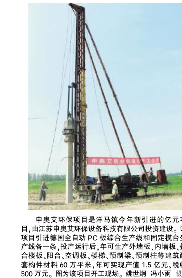
申奥艾环保项目是洋马镇今年新引进的亿元项目,由江苏申奥艾环保设备科技有限公司投资建设。该项目引进德国全自动PC板综合生产线和固定模台生产线各一条,投产运行后,年可生产外墙板、内墙板、叠合楼板、阳台、空调板、楼梯、预制梁、预制柱等建筑配套构件材料60万平米,年可实现产值1.5亿元,税收500万元。图为该项目开工现场。

市场监管局 贯彻县委全会精神“实打实” 本报讯(通讯员 李传平)县委十四届三次全会召开后,县市场监管局召开党委,认真传达全会精神。会议号召全体党员干部要以全会精神为指引,切实践行“三严三实”要求,认真谋划下半年市场监管工作,通过思想建党,切实做到“五个到位”,努力树立射阳市场监管队伍的良好形象。 该局以严要求,保障服务发展到位。抓目标导向,凝心聚力;抓责任落实,挖掘潜力;抓创新突破,提质增效;抓深化教育,鲜明导向;抓合心合力,夯实作风;努力形成奋发向上的工作目标体系、系统全面的责任落实体系和科学有效的绩效考核体系,大力服务经济发展。以硬作风,保障监管措施推进到