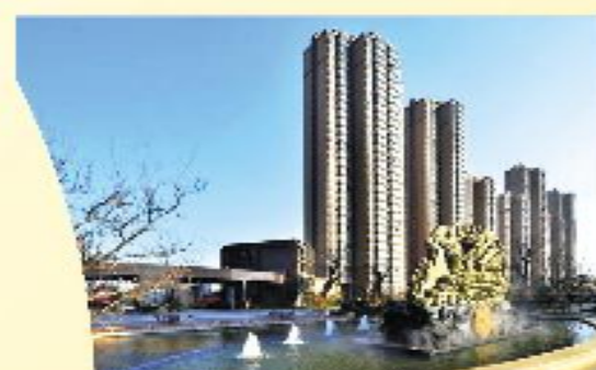
东都天润品质好口碑

合理优化布局, 对生活的细节把握, 一个不少 从小区规划, 到物业服务皆能达到行业最高标准 实景现房, 即买即住, 入住即享成熟好生活