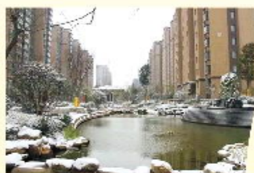
东都天润品质好口碑

精筑射阳5年时间, 1800个幸福家庭的置业选择 东都时代置业品质在高度之上, 高度在品质之中 执着于品质人居, 为您和您的家人住的更好