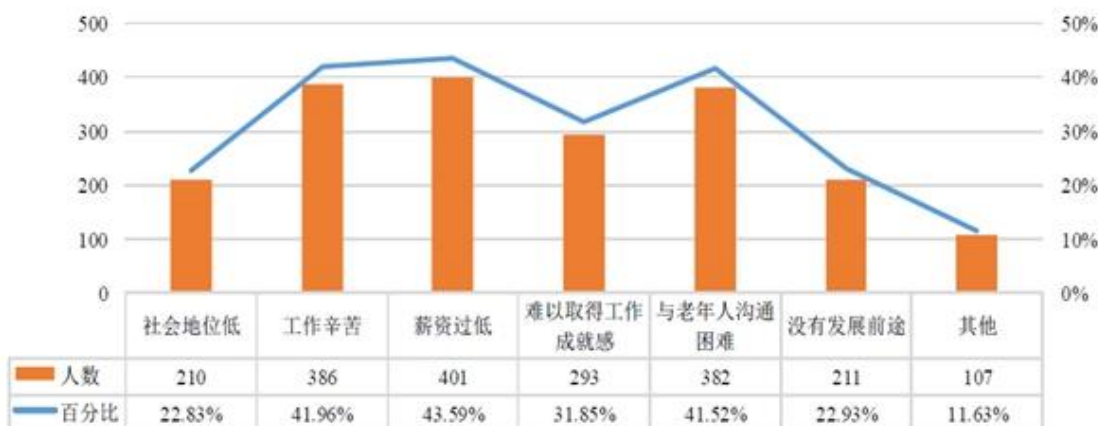
图 17 受访大学生不愿意从事养老服务工作的原因分布图

调查还显示，超七成受访大学生愿意从事养老服务工作，有不到三成的受访大学生不愿意从事。薪资过低、工作辛苦、与老年人沟通困难，是受访大学生不愿意从事养老服务工作的前三大原因。薪资水平与职业要求不对等是养老产业招人难的重要原因。北京市劳动保障职业学院工商管理系主任王建民认为，养老行业工作强度大、心理压力但收入相对来说不高，这是养老行业遭遇人才瓶颈的根源所在。“我们调查过我们学校学生的工资期望值，是每月不能少于5000元，这在北京相当于餐厅服务员水平。”王建民说。报告对受访大学生期望薪资的调查显示，40.14%的受访大学生选择5001~7000元一档，占比最高，其次是3001~5000元一档，占比为32.40%。分类来看，随着受访大学生家庭年收入的提高，大学生对薪资的期待程度上升。此外，来自经济发达地区的养老服务相关专业大学生期望的税前薪资明显高于来自经济不发达地区的大学生。