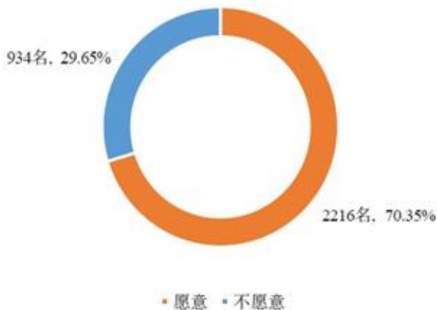
图 16 受访大学生是否愿意从事养老服务工作的分布图