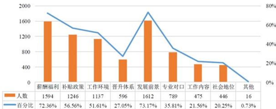
图 68 受访大学生对养老行业留人措施看法的分布图

报告显示，补贴机制健全是大学生对养老行业发展的首要政策期待。有73.09%的受访大学生认为应该提高养老服务岗位的入职补贴，占比最大，其次是有63.68%的受访大学生选择了养老服务岗位社保补贴。