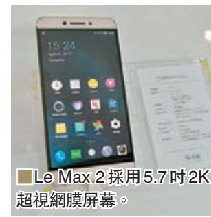
■Le Max 2採用5.7吋2K超視網膜屏幕。

至於Le Max 2則採用市面上目前最強的Qualcomm Snapdragon 820頂級處理器，並引進6GB超大記憶體及64GB儲存空間，是全球首款支援雙標準QC3.0加PD快充協定的手機，只需充電5分鐘便可通話3.5小時。Le Max 2同樣採用Sony IMX 230感測器及2,100萬像素的後置鏡頭，並支援光學防手震，亦是全球首款公開發售的超聲波金屬指紋手機，還有5.7吋2K超視網膜屏幕。Le Max 2相對上述兩部手機稍貴一點，售價為人民幣2,099元；雙6版則為人民幣2,499元。