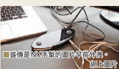
■盛傳是NX手掣的圖片早前外洩。網上圖片

今年絕對是家用遊戲界的頂峰對決，因三大廠商近日相繼發功，將在今秋至明年推出新機，讓走勢開始轉慢的現役平台注入新衝擊。雖然索尼未就「PS4.5」或「Neo」的傳聞予以否定，但隨著PS VR今秋推出，有理由相信這部PS4加強版將投入市場，給未入市的朋友一步到位享受VR的樂趣。微軟據報也會在6月中E3期間發表新主機和手掣產品，料是針對「PS4.5」而來。