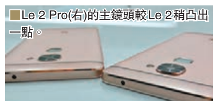
■Le 2 Pro(右)的主鏡頭較Le 2稍凸出一點。

從外形看，三款手機好像沒有分別，但只要仔細一看，有些位置是有不同的，如其後置鏡頭便有高低之分。內裡其實各自獨當一面，Le 2擁有雙卡任意插槽設計，可支援雙卡雙待雙4G，配備3GB內存及32GB儲存空間，加上全球首款MediaTek Helio X20十核處理器與完美圖形處理器，前、後鏡頭解像度分別高達800萬及1,600萬像素，並配備滾珠閉環馬達，最快能於0.09秒極速對焦。在三款超級手機中，售價為人民幣1,099元的它是最便宜的。