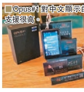
■Opus#1對中文顯示的支援很高。

於活動尾聲，筆者透過大會提供的Earphone試聽這新機，更選聽阿敬的《對你太在乎》等三首發燒級錄音歌曲。和一般播放器比，能播放高清晰音源的Opus#1固然贏了幾條街，因歌曲取樣有別，由樂器擺位、層次以至演唱者的換氣聲都聽得清楚，不同樂器演奏時的質感是普通播放器所無法比擬。基於高清晰播放器動輒賣過萬港元，該「泡菜機」以入門級以上的中價位絕對是合格有餘。零售價：$5,280