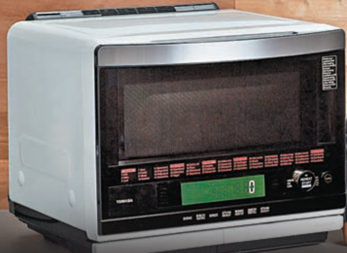
■水波爐在香港面世已有一段日子，但對許多主婦還是相當陌生的。

本周日(8日)便是母親節，為子女固然要好好孝順至親。媽媽平時煮飯很辛苦，送給她既能減輕工夫、又可煮出美味食物的器材，實為母親節禮物的一個好選擇，觀乎近年各電器廠商把科技引入到如電飯煲和微波爐等產品，不再單純煮餐飯，而是追求更健康、更舒適的生活享受。 文：電能小子