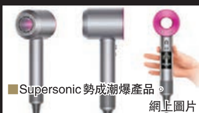
■Supersonic勢成潮爆產品。

玩盡高科技的不僅是煮食用具，英國著名電器潮牌Dyson上星期在東京舉行盛大發售會，向全球首度披露其無扇葉風筒「Dyson Supersonic」，瞬即成為話題。Dyson在香港已有相當滲透率，它的無扇葉風筒與高效能吸塵機早就大行其道，廠商進一步利用其技術與獨到外形設計，花上四年來研發出類似原理的風筒。