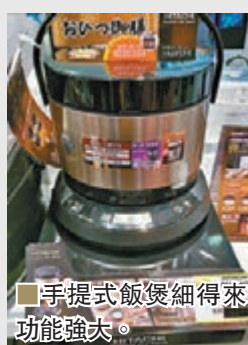
■手提式飯煲細得來功能強大。

並非個個家庭都是人多勢眾，有時若只有兩大一小，甚至是夫婦間擱柙，確實無須買太大的飯煲。在現時各廠商都有推出新式智能飯煲下，日立這款外形獨特的RZ-WS4YH可用驚為天人來形容，因它採用分離式設計，可在飯熟後把盛着米飯的上層直接放到餐桌上，用餐者不用專登行過去裝飯！