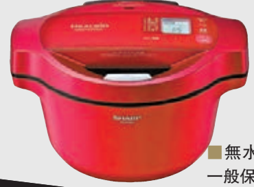
■無水電鍋外表跟一般保溫鍋無異。零售價：約$4,400

無水電鍋的原理是，用戶把含有水分的材料如蔬菜和肉類放進鍋內，其密封設計可大大減低水分蒸發，同時它內置一個攪拌爪子，舉例當在煮咖啡時，我們平時是要不停攪動以免黏底，如今則完全不經人手代勞。更厲害是，主婦們可預先設定好時間，在臨開飯前半至一小時才啟動電鍋，那麼剛煮好的食物就能新鮮滾熱辣送上，不用擔心預先煮好後涼掉、需要翻熱導致營養流失的問題。