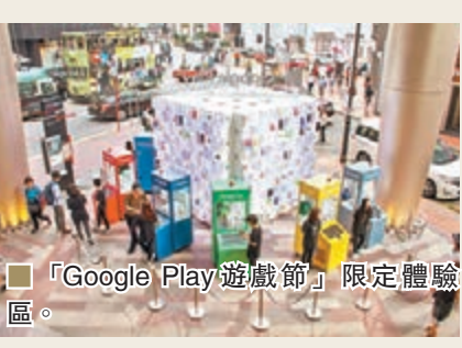
■「Google Play遊戲節」限定體驗區。

由即日起至本週三，Google於利舞台廣場舉辦「Google Play遊戲節」期間限定體驗區，展出12款重點推介的Google Play手機遊戲，以「430」開始重拾由上世紀80年代430至今的童心玩樂精神，讓玩家親臨現場免費挑戰各款火熱遊戲，爭取夾中近百款實體「寶物」獎賞。手機用戶同時亦可在本月16日之前，前往Google Play遊戲節專頁(g.co/GameFest430)享獲每日不同的特定獎賞。