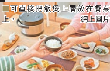
■可直接把飯煲上層放在餐桌上。

這個日本生產飯煲的基本功能，跟市場上其他飯煲大同小異，其獨特之處在於擁有極強的保溫效果，只要關上蓋子，就算離開下層的電源座，兩小時後上層依然能保持在70℃左右，不比插住電來保溫遜色。亦因針對小家庭需要，它設有「Eco少量飯」模式，想煮一人的飯量亦沒問題，不怕弄壞煲子。