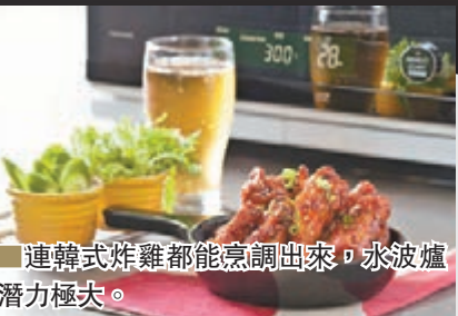
■連韓式炸雞都能烹調出來，水波爐潛力極大。

各位對微波爐及焗爐應不會感陌生，那麼水波爐又是什麼一回事？這款近年在日本大行其道的產品，顧名思義是含有水的要素的微波爐，旨在透過高溫水蒸氣把食物中的油分和鹽分逼出來，達到「少油少鹽」的健康進食效果。難怪去年台灣不少博客，都大力推薦人們在赴日旅行時都要帶一部水波爐走！