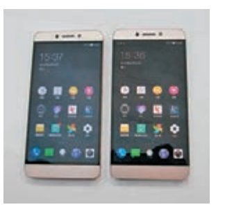
■Le 2(左)與Le 2 Pro繼續走廉價但性能強大的路線。

自從取得英超的香港播映權後，LeEco樂視這名稱廣為人熟悉，連其超級手機都多了機迷注意，皆因手機將能觀看英超賽事。早前這品牌於北京舉辦「Breaking Boundaries, Technology Connects the World」發佈會，一次過公佈四款終端產品，當中的第二代超級手機共分三個新型號Le 2、Le 2 Pro及Le Max 2，全為金屬一體化機身。最特別是手機取消3.5mm耳機插孔，利用CDLA技術配合Type-C傳送模式，顛覆了30年來未曾改變的耳機市場，帶領手機音樂行業進入新時代。