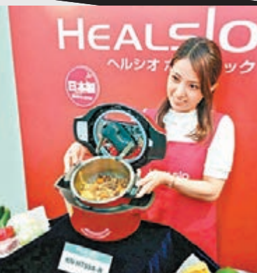
■這個鍋靠蓋底的攪拌爪來煮食物。

若嫌水波爐在香港已有得賣，聽起來不夠「潮」，那麼聲寶這個無水電鍋應能引起你的注意。目前並未登陸香港的這個紅色電鍋，在日本推出了只有半年，外表頗像一個保溫煲，事實上其主打賣點是無水煮食，把平時烹調時會流失逾一半營養的情況大大減低至兩成多！