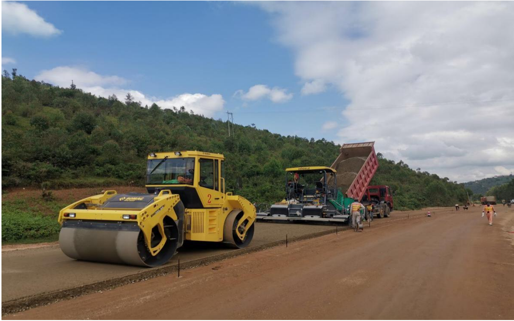
中国电建胡耶66公里路路面施工