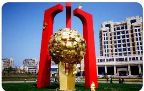
奉贤校区地标建筑“知识之门”

现有奉贤校区和徐汇校区两个校区，占地面积共 1102762.6 平方米，校舍建筑