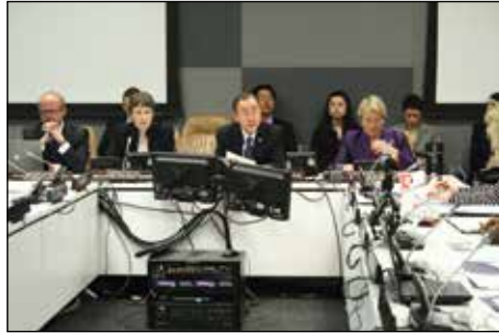
开幕致辞：国际IDEA秘书长Vidar Helgesen先生（左）、联合国开发计划署（UNDP）署长海伦. 克拉克女士（中左）、联合国秘书长潘基文先生（中右）、联合国妇女署执行主任米歇尔. 巴切莱特女士（右）