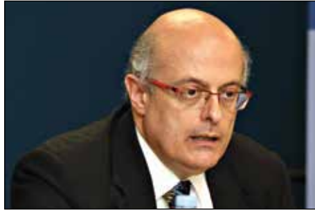
国际IDEA常驻联合国观察员Massimo Tommasoli博士