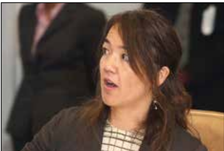
背景：全球性别研究所主任Mala Htun教授