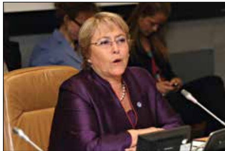
联合国妇女署执行主任米歇尔. 巴切莱特女士