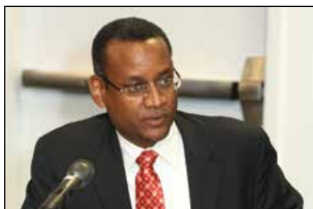
美国宪法权利中心主任Vincent Warren先生