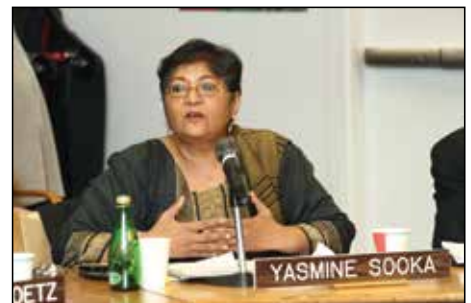
南非人权基金会总监Yasmin Sooka女士