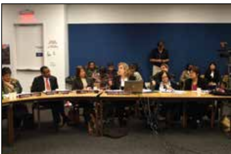
专题会议3：南非人权基金会总监Yasmin Sooka女士（左）、美国宪法权利中心主任Vincent Warren先生（中左）、全球性别研究所主任Mala Htun教授（中右）、突尼斯阿拉伯妇女培训和研究中心主任Soukeina Bouraoui博士（右）