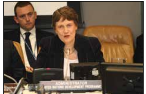
联合国开发计划署（UNDP）署长海伦. 克拉克女士