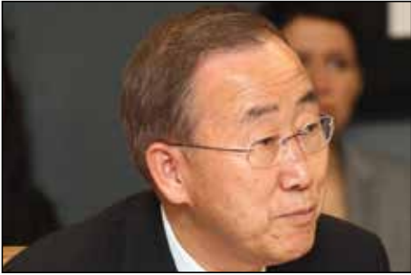
联合国秘书长潘基文先生