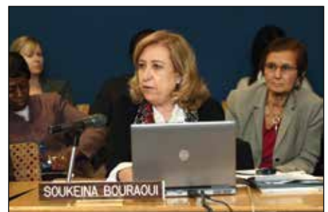
突尼斯阿拉伯妇女培训和研究中心主任Soukeina Bouraoui博士