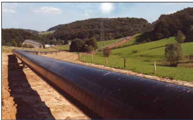
油气管线泄漏监测