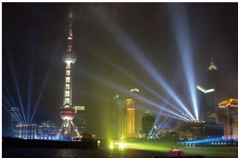
上海以「十里洋場」的恢弘氣度，廣納國際人士。