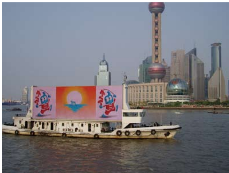
上海是年輕人創業的天堂。（攝影／王翠華）