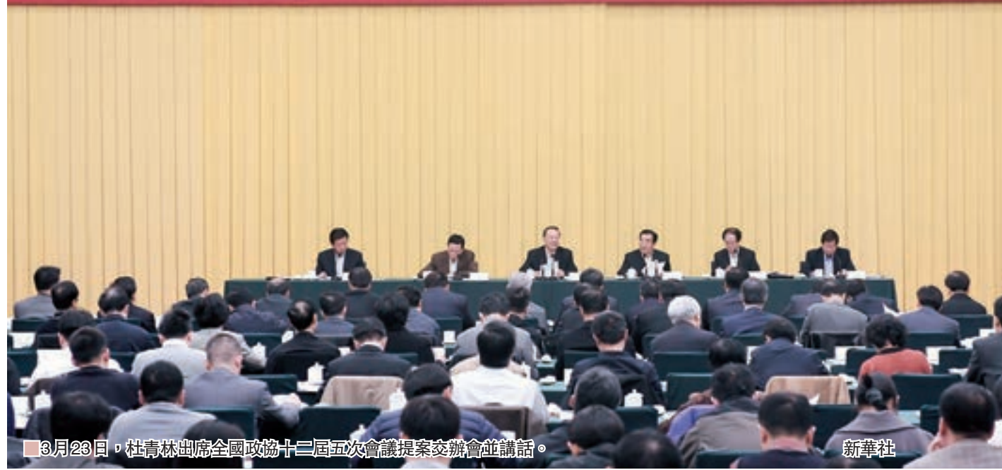
3月23日，杜青林出席全國政協十二屆五次會議提案交辦會並講話。