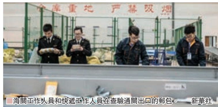
海關工作人員和快遞工作人員在查驗通關出口的郵包。