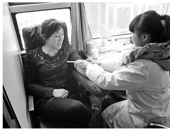
1月28日,洛川县后子头超限站积极参与无偿献血活动,组织职工踊跃献血,奉献爱心。