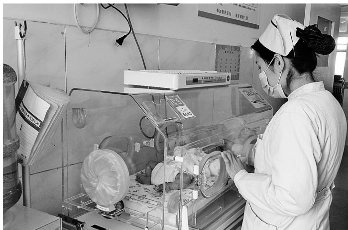
● 博爱医院的护士看护着保温箱的男婴

民警告诉记者,遗弃婴儿已经触犯了《中华人民共和国刑法》第二百六十一条遗弃罪,此案正在调查之中,将会全力寻找孩子的父母。