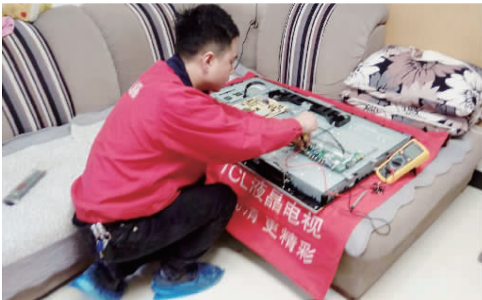
家电维修最好找“正规军”,否则多花冤枉钱。

不难发现维修家电的小广告。而且小广告上都会特意注明“某某品牌授权维修”。不过,联系生产厂家,却纷纷表示,“没有任何关系。”