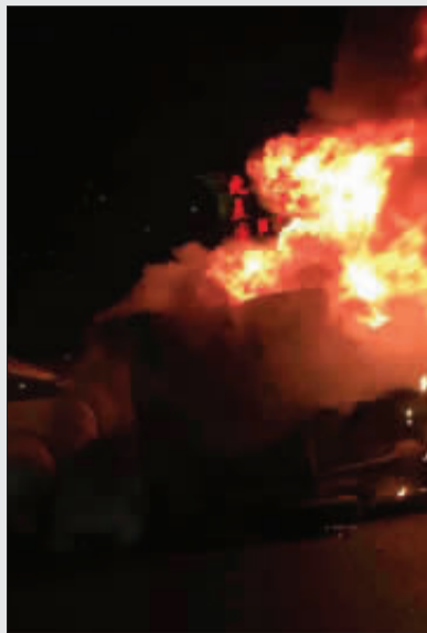
上周六,中环上一车辆因侧翻起火。