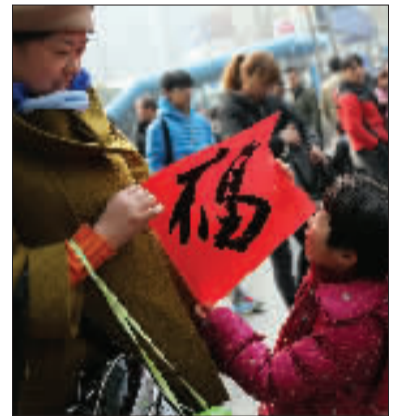
孩子拿着“福”字回家过春节。

2月11、13、15日南京南至上海虹桥加开G329次,上海虹桥至合肥加开G242/3次,合肥至上海虹桥加开G244/1次,上海虹桥至徐州东加开G278次,徐州东至上海虹桥加开G277次,2月12、14、16日上海虹桥至徐州东加开G7300次,徐州东至上海加开G7299次,上海至南京加开G330次。