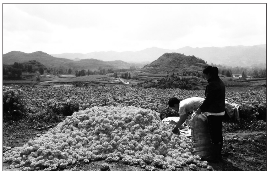
贵州省威宁自治县上万亩素有“软黄金”之称的万寿菊日前进入采收收购期,一朵朵金黄色的饱满花朵煞是喜人,不仅给原本沉寂的田野增添了无限生机,改善了生态环境,也给农民们带来了上千万元的经济收入。