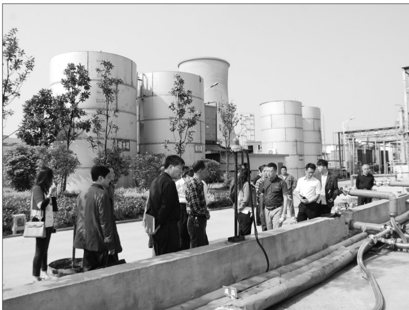
图为泰州姜堰乡村环保生态家园协会组织会员视察企业污染防治现场。