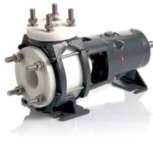
带机械密封的离心泵