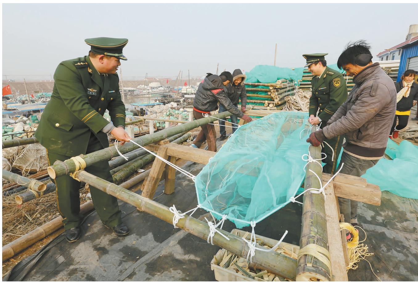
12月20日,连兴港边防派出所民警在港口和渔民一起抬筐搭架、拉线结网,为即将到来的鳊鱼苗捕捞做准备。鳊鱼苗俗称海上“软黄金”,近年来鳊鱼苗价格一路高企。而长江口是鳊鱼苗的主要产区,每年都会吸引上千名“淘金者”集聚长江口。从12月份开始,鳊鱼捕捞即将进入的黄金季节,连兴港港口数百条渔船已蓄势待发。

人民医院创新和丰富学习形式,组织全体医务人员学习了《执业医师法》、《药品管理法》、《传染病防治法》、《侵权责任法》等相关法律法规,提高依法行医管理水平和执业水平。并有针对性地开展了真实案例解析和法制道德讲堂,拉近法律条文与个人行为之间的距离。与此同时,全院干部职工坚持搞好自学,认真学习学习笔记,撰写学习心得体会。(袁圣平 卑其欢)