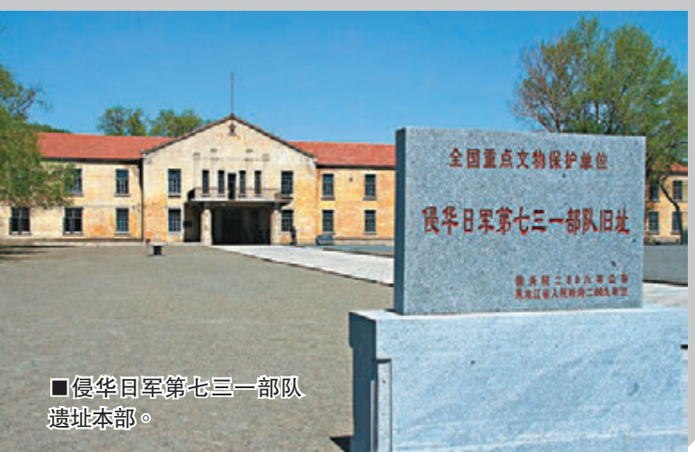
■侵华日军第七三一部队遗址本部。

另悉，哈尔滨今年将正式启动侵华日军第七三一部队罪证陈列馆新馆建设，新馆建成后，旧馆将作为文物进行保护；同时还将在已发现区域建造遗址文化公园，目前遗址公园已完成规划并审批通过，年内将启动实施。