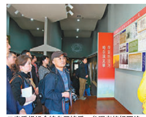
■安重根纪念馆自开馆后，参观者络绎不绝。

1909年10月26日9时30分，来自朝鲜半岛的抗日义士安重根在哈尔滨火车站的站台上，