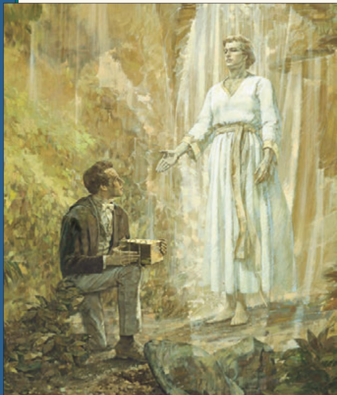
摩羅乃連續四年，每年都回去給年少的約瑟進一步指示。在那四年後，約瑟獲得了頁片，並且開始翻譯摩爾門經。

常那樣工作時，發覺自己體力已衰竭到完全不能工作。我父親與我一起工作，發現我有些不對勁，就叫我回家。我動身打算走回家去；但是我正要越過圍欄，離開我們所在的那塊田地時，我體力完全不支、無助地倒在地上，有一陣子不省人事。