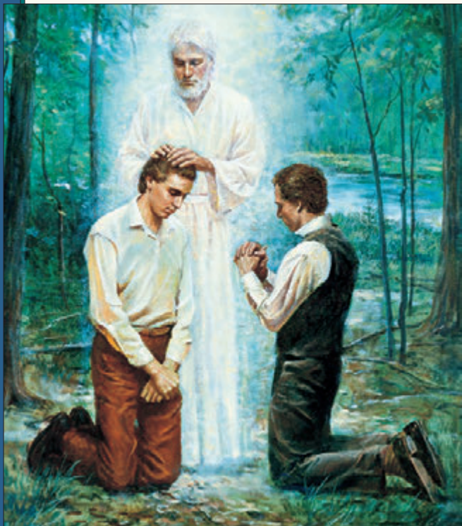
1829年5月15日，約瑟·斯密和奧利佛·考德里由施洗約翰按手，接受亞倫聖職。