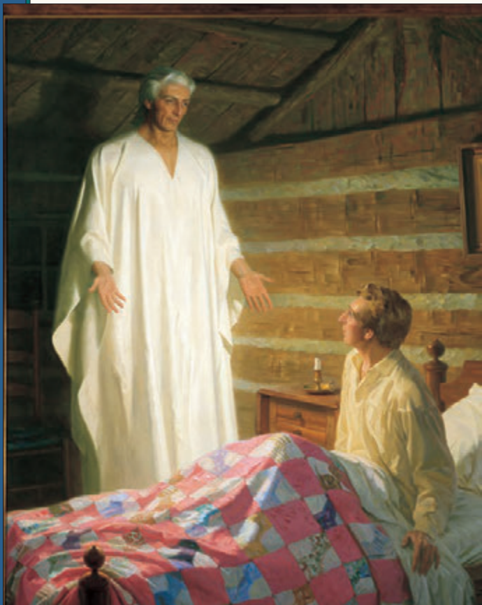
在約瑟·斯密第一次異象的三年後，神派遣天使摩羅乃指示約瑟有關復興耶穌基督福音的事。