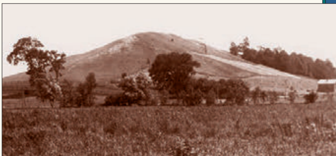
克謨拉山位於紐約州拋邁拉斯密農場東南方約5公里處。在約瑟的時代，此山丘的北邊緣草如茵，南邊則是一片林地。那些頁片被埋在西邊，距離山頂不遠的地方。這幀照片攝於1907年8月。

此時，在我腦海的印象如此深刻，使我睡意全消，我躺在那兒，對剛才所看到和聽到的感到驚訝。但是更叫我驚訝的是，我又看見同一位使者在我床邊，並聽到他又將先前告訴我的同樣的事向我重述或重覆一遍；然後加上給我的警告，告訴我撒但會設法誘惑我拿那些頁片來致富（因為我父親家貧窮的環境）。他禁止我這樣做，