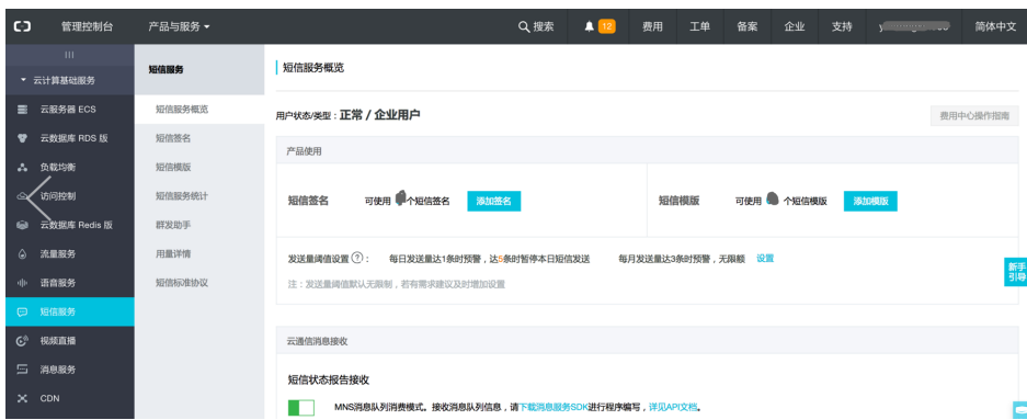
2、问：知道自己属于可以使用