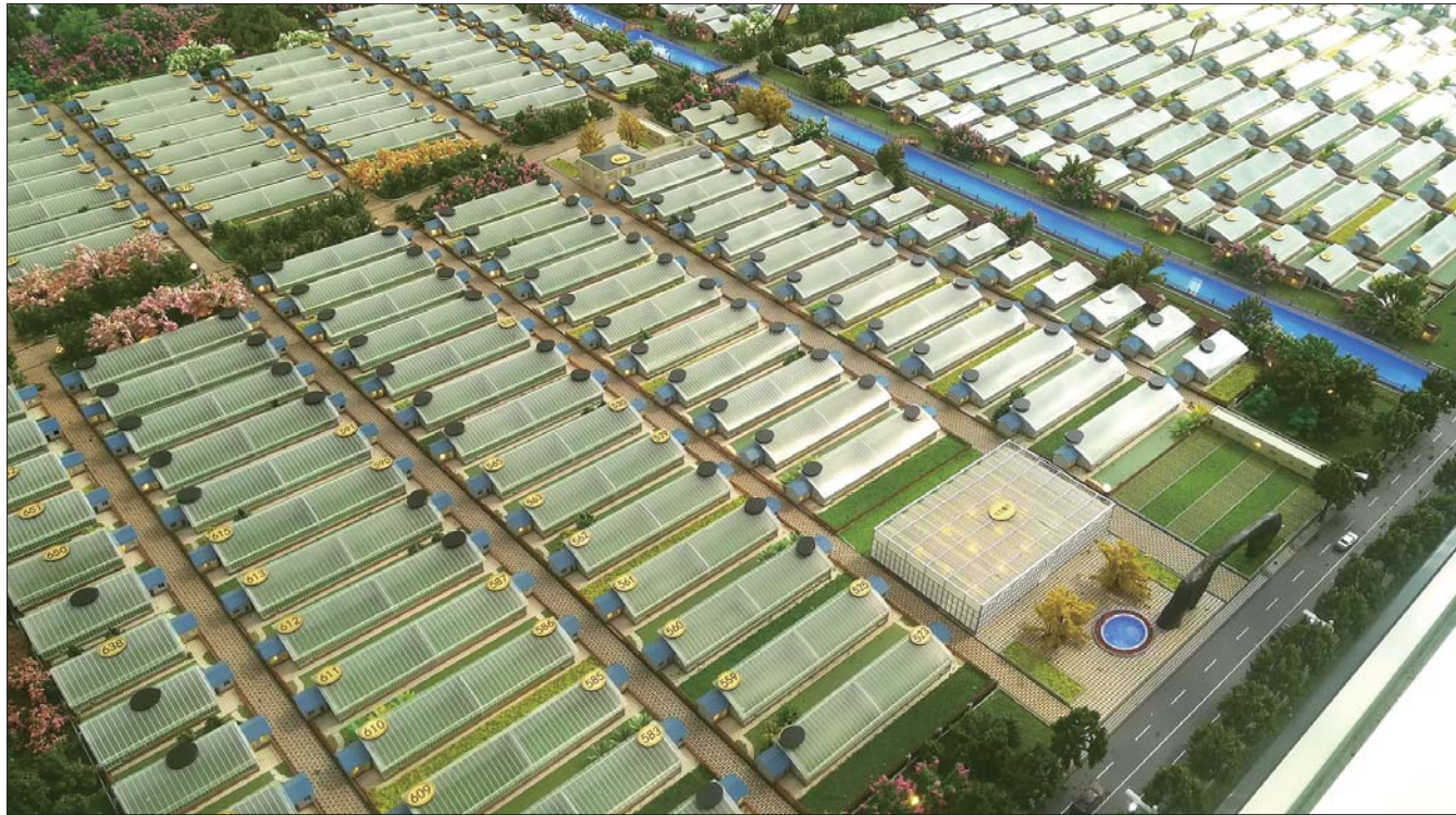
紫薇庄园项目沙盘,上面均是计划承租出去的“大棚”。