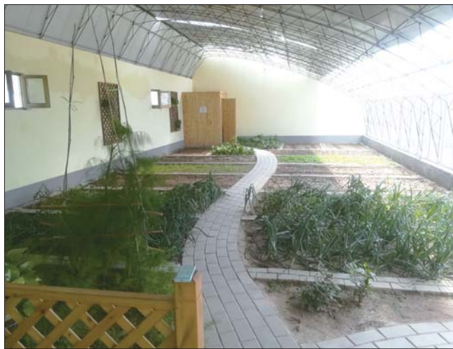
宽敞的阳光大棚,据销售人员介绍,业主租下来后可以随意装修。