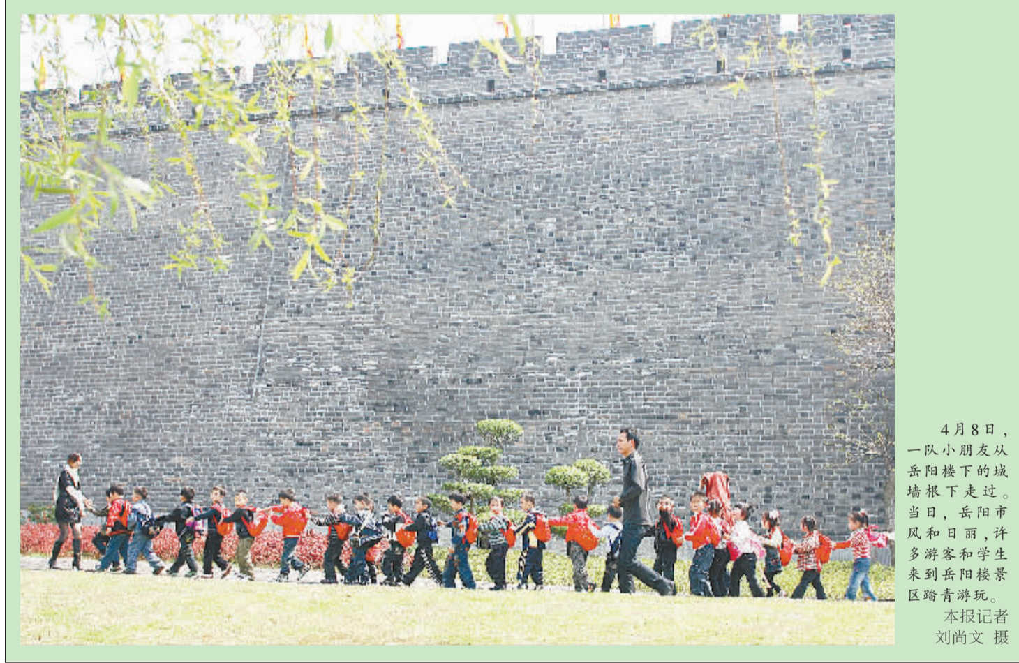
4月8日,一队小朋友从岳阳楼下的城墙根下走过。当日,岳阳市风和日丽,许多游客和学生来到岳阳楼景区踏青游玩。 本报记者 刘尚文 摄

为提高生产能力,去年以来,公司投入5500万元,对白炭黑第三、第四线的热风炉等进行改造,使白炭黑生产成本每吨下降了200元左右。同时,投资4500万元,建成了一条国内最先进的年产硅酸钠12.5万吨的生产线,使生产成本明显降低,每吨产品仅煤、电两项就减少成本100元左右。