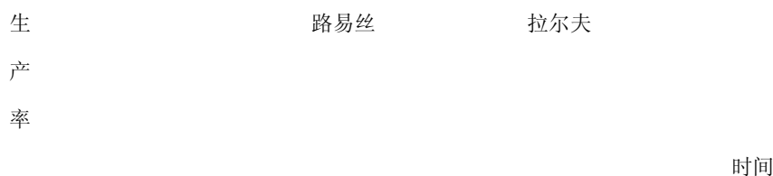
图 31-3 因为人事变动造成的生产损失

路易丝离开时生产力受到打击，甚至一度降至零以下，而团队其他人赶紧弥补失去一位契合良好的团队成员所造成的损失。然后生产力可能会回复到它以前的水平。