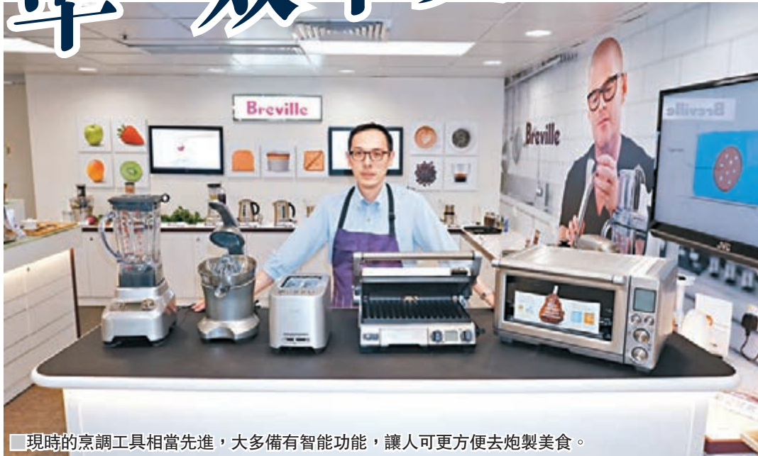
■ 現時的烹調工具相當先進，大多備有智能功能，讓人可更方便去炮製美食。