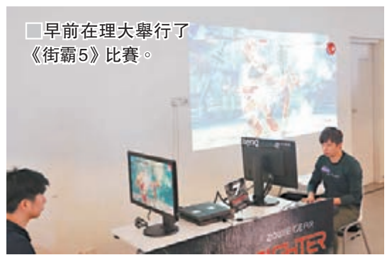
■ 早前在理大舉行了《街霸 5》比賽。