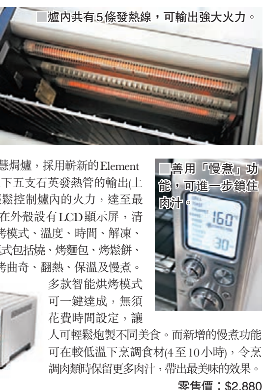
■ 爐內共有 5 條發熱線，可輸出強大火力。 ■ 善用「慢煮」功能，可進一步鎖住肉汁。 ■ 智慧型焗爐

由微波爐到水波爐，市民已愈來愈懂得養生之道，會利用更多的烹調方式來提升生活質素。當然，論用途廣泛性，焗爐能夠煮出的美食種類其實遠較微波爐為多，亦更健康，而這款火力高達 2400W 的智慧焗爐，採用嶄新的 Element IQ 技術，能準確調節上下五支石英發熱管的輸出(上三支，下兩支)，藉此輕鬆控制爐內的火力，達至最理想的烘培效果。該爐在外殼設有 LCD 顯示屏，清楚顯示它的十種預設烘烤模式、溫度、時間、解凍、內裡對流等狀態，這些模式包括燒、烤麵包、烤鬆餅、烘焙、烤烘、烤薄餅、烤曲奇、翻熱、保溫及慢煮。多款智能烘烤模式可一鍵達成，無須花費時間設定，讓人可輕鬆炮製不同美食。而新增的慢煮功能可在較低溫度烹調食材(4至10小時)，令烹調肉類時保留更多肉汁，帶出最美味的效果。 零售價：$2,880