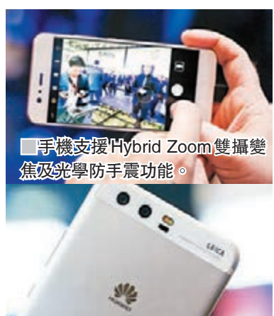
■ 手機支援 Hybrid Zoom 雙攝變焦及光學防手震功能。 ■ P10 系列配備 2,000 萬像素黑白及 1,200 萬像素彩色雙鏡頭。

自從 Huawei 與 Leica 合作推出 P9 以來，這款手機大受歡迎，而剛於 Mobile World Congress 2017(MWC) 期間，華為再與 Leica 合作，推出採用全新相機配置的 P10 及 P10 Plus。系列首次加入 800 萬像素的 Leica 認證前置鏡頭，能夠根據畫面人物數量，自動切換單人自拍模式或廣角群拍模式，單人自拍時清晰自然，多人拍攝則有更廣的取景角度，即使自拍都能夠呈現富藝術感的人像拍攝效果。