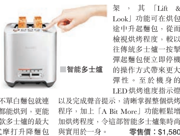
■ 智能多士爐 架，其「Lift & Look」功能可在烘包途中升起麵包，從而檢視烘烤程度，較以往傳統多士爐一按掣彈起麵包便立即停機的操作方式帶來更大彈性。至於機身的 LED 烘烤進度指示燈以及完成聲音提示，清晰掌握整個烘烤程序，加上「A Bit More」功能輕鬆增加烘烤程度，令這部智能多士爐集時尚與實用於一身。 零售價：$1,580

平時我們也未必會買多士爐回家，皆因其給用家的既有印象是使用很落後的科技，兼且很易會烘焦麵包，用途非常有限。如今這款智能多士爐，不單用上鋁合金外殼，充滿時代感，更藉着智能設計來處理多種不同麵包，不單白麵包就連麥包、果包甚至烤餅等都能烘到，更能照顧到使用者健康。這款多士爐的最大特點，就是備有一按式摩打升降麵包架，其「Lift & Look」功能可在烘包途中升起麵包，從而檢視烘烤程度，較以往傳統多士爐一按掣彈起麵包便立即停機的操作方式帶來更大彈性。至於機身的 LED 烘烤進度指示燈以及完成聲音提示，清晰掌握整個烘烤程序，加上「A Bit More」功能輕鬆增加烘烤程度，令這部智能多士爐集時尚與實用於一身。 零售價：$1,580