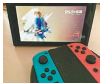
■ Nintendo Switch 經已發售，現處供不應求的狀態。

任天堂全新家用機 Nintendo Switch(NS)，上周已於本港推出，而上周三先有較貴的水貨殺到，主機連遊戲一度升逾 $4,000；到兩日後行貨版出現在港九新界各遊戲店，結果周圍也見買機人龍。如之前已在店舖預購，那麼在首賣日便能以相對合理的價錢出機，否則無論行、水貨版都要捱炒價，可幸比起以往的新機，NS 的炒價幅度不算很高，算是能夠接受。