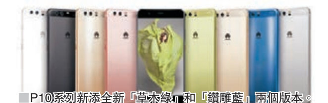
■ P10 系列新添全新「草木綠」和「鑽雕藍」兩個版本。