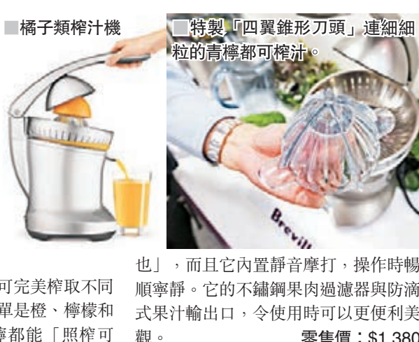
■ 橘子類榨汁機 特製「四翼錐形刀頭」連細細的青檸都可榨出。 也」，而且它內置靜音摩打，操作時暢順寧靜。它的不鏽鋼果肉過濾器與防滴式果汁輸出口，令使用時可以更便利美觀。 零售價：$1,380

雖然攪拌機也能榨汁，但大前提是要先去皮，如只想做橙汁又不想麻煩，用榨汁機確是更便利。這款榨汁機採用傳統的下壓式設計，榨汁時可減少手指接觸水果的機會，即使單手操作都能夠輕鬆榨取最多果汁。它備有專利設計「四翼錐形刀頭」，可完美榨取不同大小的橘子類水果，不單是橙、檸檬和西柚等，連細小的青檸都能「照榨可也」，而且它內置靜音摩打，操作時暢順寧靜。它的不鏽鋼果肉過濾器與防滴式果汁輸出口，令使用時可以更便利美觀。 零售價：$1,380