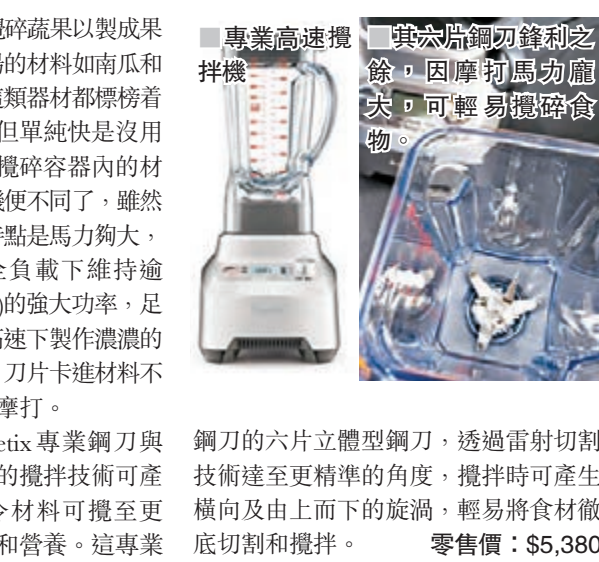
■ 專業高速攪拌機 其六片鋼刀鋒利之餘，因摩打馬力龐大，可輕易攪碎食物。 鋼刀的六片立體型鋼刀，透過雷射切割技術達至更精準的角度，攪拌時可產生橫向及由上而下的旋渦，輕易將食材徹底切割和攪拌。 零售價：$5,380

通常攪拌機都是用來攪碎蔬果以製成果汁，或者切碎烹調西式湯的材料如南瓜和磨菇等，雖然坊間不少這類器材都標榜着「高速」和「輕巧」，但單純快是沒用的，始終最重要還是能攪碎容器內的材料。這款專業高速攪拌機便不同了，雖然它速度驚人，但其最大特點是馬力夠大，其 3 匹馬力摩打可在全負載下維持逾 12,000 RPM(每分鐘轉數)的強大功率，足以切碎大量材料，並在高速下製作濃濃的汁液。如攪拌機不夠力，刀片卡進材料不能動彈，最終只會損毀摩打。另外，它的 Pro Kinetix 專業鋼刀與碗形攪拌系統，較傳統的攪拌技術可產生多 50% 微細粒子，令材料可攪至更幼細，釋放出更多味道和營養。這專業鋼刀的六片立體型鋼刀，透過雷射切割技術達至更精準的角度，攪拌時可產生橫向及由上而下的旋渦，輕易將食材徹底切割和攪拌。 零售價：$5,380