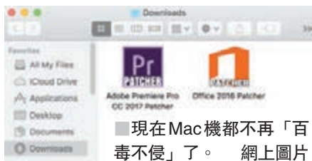
■ 現在 Mac 機都不再「百毒不侵」了。

雖然 Mac 機並非完全不會受病毒影響，但在正常使用條件下，出事的機會率確是相當低。然而過往讓 PC 用家大為苦惱的勒索軟件，現終於發展到 Mac 機上，包括《福布斯》等外媒日前指出，一款名叫 Patcher 的勒索軟件正針對蘋果自家的程序編寫語言 Swift 而誕生，據知它是隱藏在非法下載的軟件如 Microsoft Office 2016 和 Adobe Premier Pro CC 2017 之中，只要透過 BT 下載後再試圖安裝，那麼 Mac 機就會「中招」，要麼花費大筆金錢「贖身」，要麼痛失電腦內的寶貴檔案。解決方法？就是別貪小便宜，不要非法下載，只經可信的途徑去下載程式，基本上已是萬無一失。 文：至尊寶