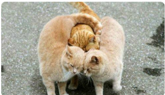
前面的两个麻烦让让