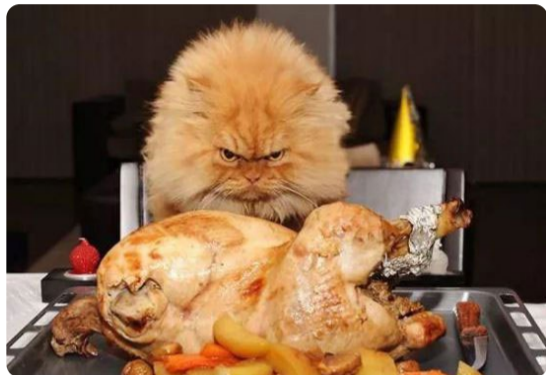
今天这鸡我是吃定了