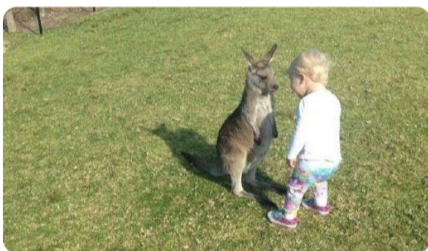
这片草原上只能有一个王者