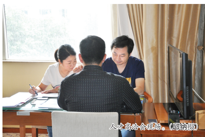
人才高洽会现场。

高层次人才洽谈会是区人力资源服务中心精准引才的有力抓手，也是助力吴江企业转型升级，为企业提供高层次、紧缺型专业管理人才和技术人才的公益性平台。自2007年以来，该活动每年举办两次。从2017年开始，区人力资源服务中心加大高层次人才引进力度，将原本