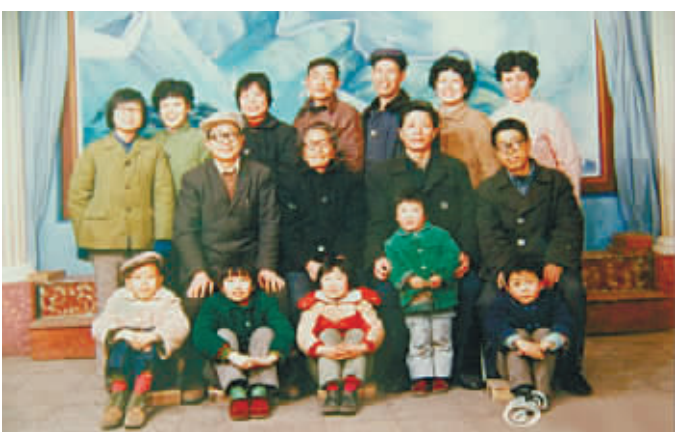
@Yvonne兰轩:照片中6岁,摄于1988年。