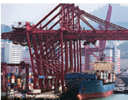
▲全球经济环境有所改善，倘若持续，可为亚洲贸易带来支持，香港出口也能受惠

其是中国台湾升82.7%、越南升46.5%、中国内地升35.9%。输往其他地区的整体出口货值录得跌幅，尤其是德国跌19%、英国（跌18.8%）和美国跌10.9%。