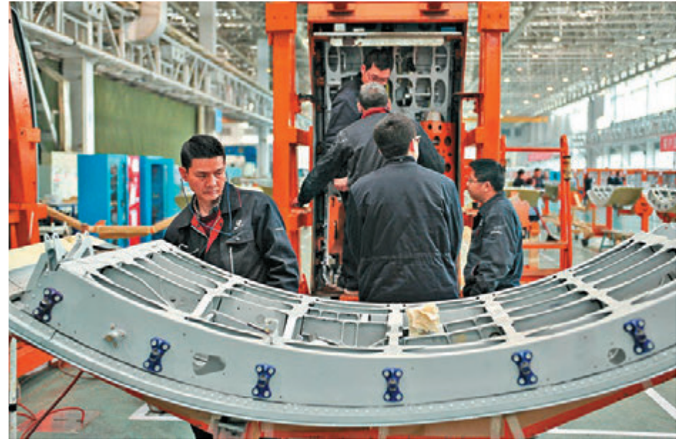
▲国家统计局指出，总体看工业企业利润仍属于恢复性增长