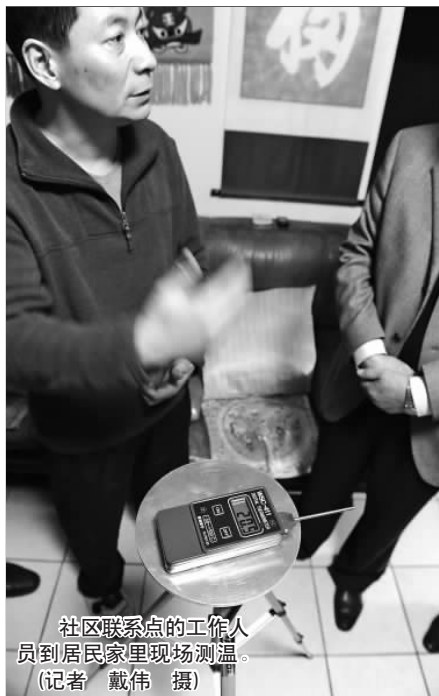
社区联系点的工作人员到居民家里现场测温。