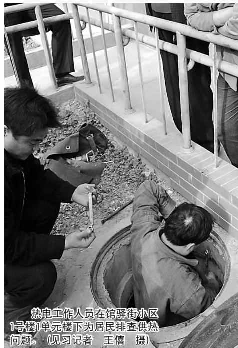
热电工作人员在馆驿街小区1号楼1单元楼下为居民排查供暖问题。