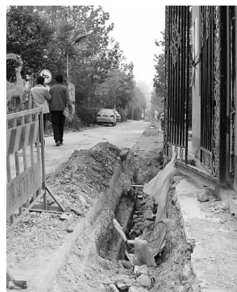
洪家楼小区正在进行管道燃气施工。今年年底前有望通上天然气。