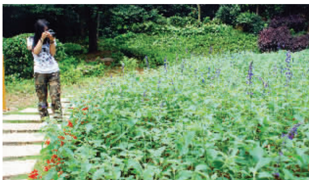
省植物园蝴蝶树薰衣草芳香旅游节14日正式开幕。 ■记者 王文

事后,长沙医保中心调查发现,近日陆续接到多位参保人电话,反映的情况和邓女士类似。对此,医保部门提醒广大参保人:对此类来电要严加防范,千万不要轻易向陌生人提供本人医保卡卡号和身份证号码等个人基本信息,以免账户资金被冒用、盗用造成经济损失。 ■记者 刘璋景