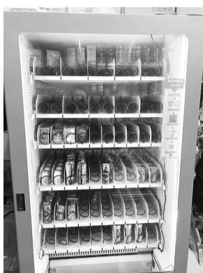
“智售客”自动售货机