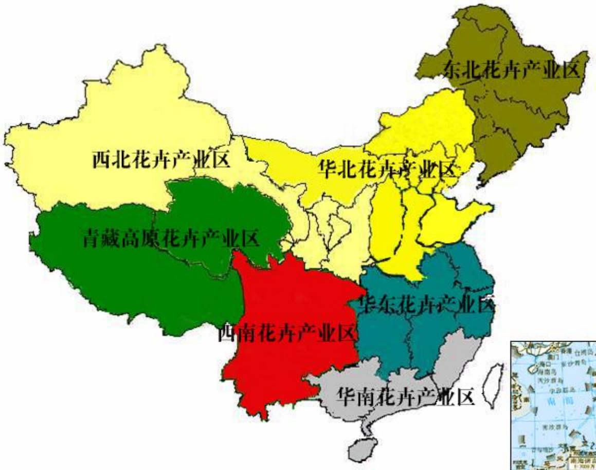
图 1：中国花卉产业布局示意图