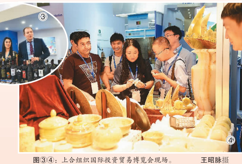
图③④：上合组织国际投资贸易博览会现场。