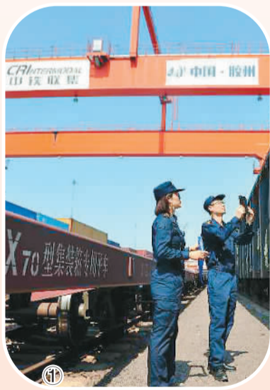
图①②：青岛海关关员在青岛多式联运海关监管中心对集装箱货物实施现场监管查验。