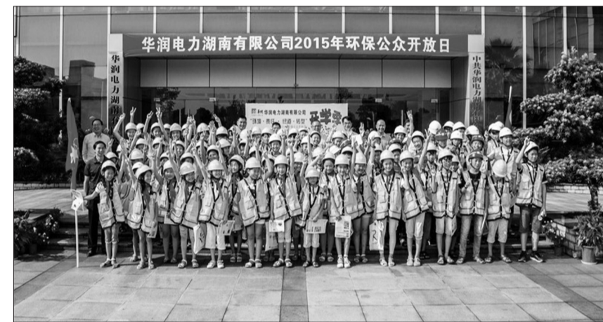
2016 环境友好型企业巡礼(16)

公司将切实履行央企社会责任,贯彻落实环境保护基本国策,严格执行新《环保法》,认真落实国家能源局印发的《煤电节能减排升级与改造行动计划(2014-2020年)》的相关要求,实施节能减排改造,供电煤耗比“十二五”至少下降5克/千瓦时;二氧化硫、氮氧化物、粉尘单位千瓦时排放量同比下降70%、35%、35%。持续保持NOSA四星评级,至少实现一家电厂五星评级;持续推进EHS示范基地建设,紧跟国家政策,加强内部管控,实现绿色发展,成为行业内安全、绿色标杆企业。