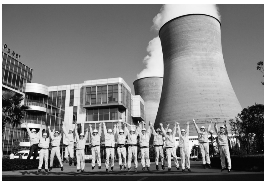
图为充满活力的电厂工人。

华润电力投资有限公司湖南分公司(以下简称“湖南分公司”)于2009年6月正式成立,下辖三家已经运营的火电厂和一家检修公司,即:湖南华润电力鲤鱼江有限公司;华润电力湖南有限公司;华润电力(涟源)有限公司;湖南华润电力检修有限公司。公司装机容量2620MW。