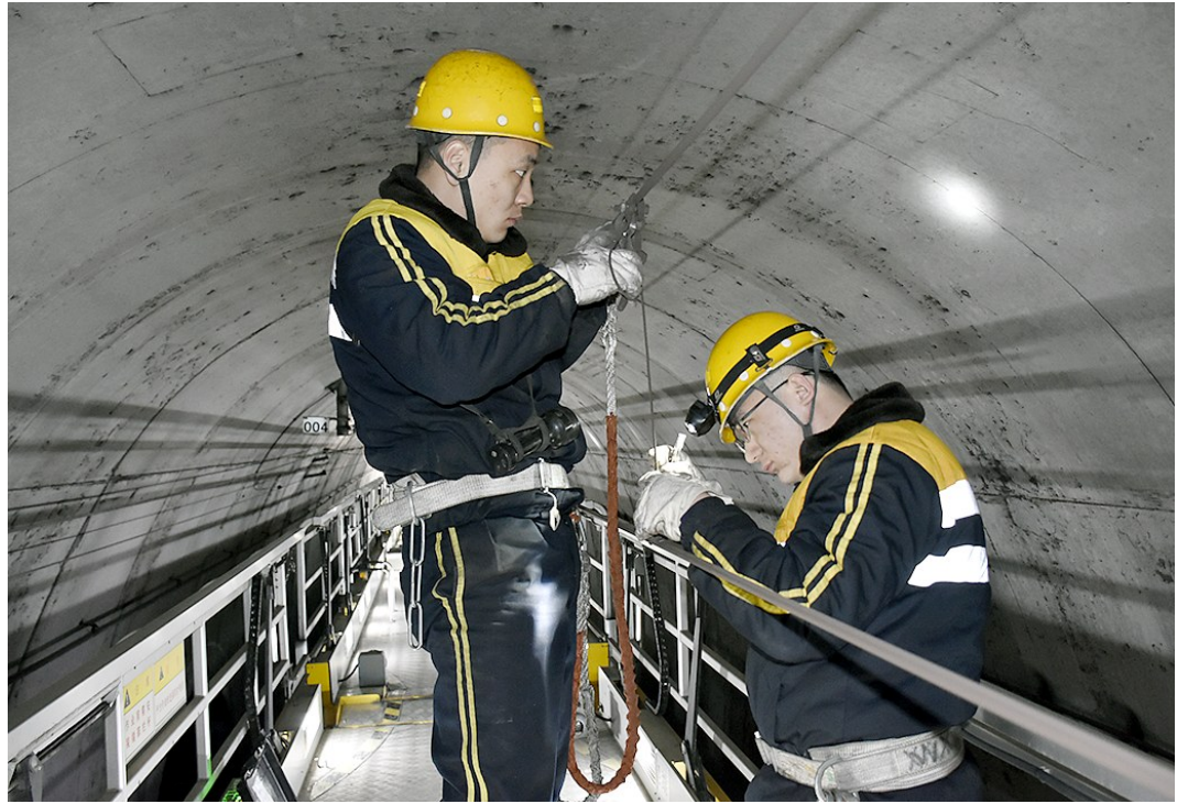
近日,2019年度电气化铁路接触网集中修在中国铁路西安局集团有限公司安康供电段管内全面展开。共有西安、镇安、小河口、大岭铺4组施工队伍各进行了西康线上行线、下行线两次集中修施工作业。

3月12日,咸阳市工人文化宫组织全体员工开展“绿色家园·播种春天”活动,共栽种樱花树150余株,为春光明媚的三月增添了一抹勃勃绿意。