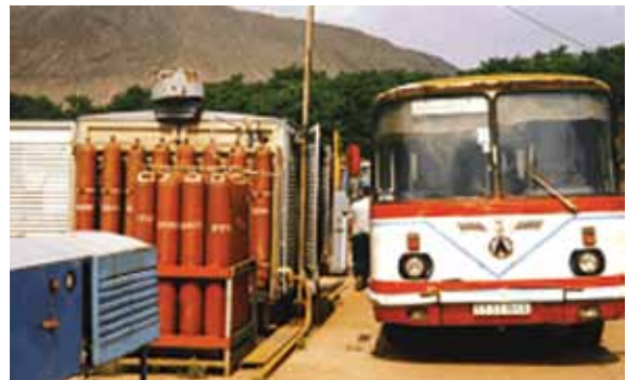
乌克兰把煤层气用作汽车燃料

全球甲烷行动（GMI）的煤矿部门将继续着眼于可带来可观减排成效的针对现场的具体评估和技术示范。这些活动将通过在世界各地的合作伙伴国家举办能力建设研讨会和培训给予支持。