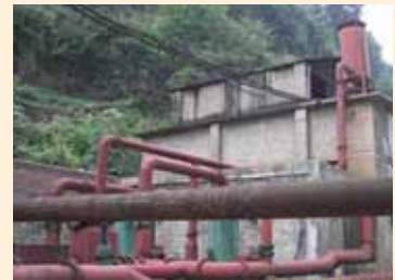
图 3：Songzao 煤矿采煤区的泵站

重庆市能源投资集团公司（CEIG）及其子公司 SCEC 正在开发每年可从中国西南部重庆直辖市松藻公司的六个运营煤矿抽采、净化和液化高达 1.3 亿米 3 中等品质煤层气（CMM）的项目。所生产的液化天然气（LNG）将用卡车运往当地使用和供应南部和东部的天然气消费中心。省政府所有者正在考虑增设第二家年产能为 4,000 万米 3 的工厂，以净化和液化源自这些煤矿煤层气生产的新增部分。另外，该项目还包括在松藻公司煤矿的新建电站建造发电能力达 26.9-MW 的内燃机，此将每年燃烧掉无法以低的成本运至液化天然气（LNG）工厂的 3,800 万米 3 额外 CMM。所有者预计该项目将于 2012 年正式投产，年减排能力约达 2.93 百万公吨 CO 2 当量，15 年设计寿命期间的减排总量将达 44 百万公吨 CO 2 当量。