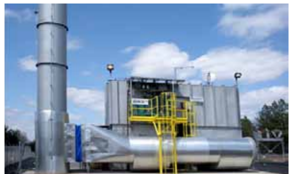
美国 Jim Walter Resources 4 号煤矿的 VAMOX 系统

欲了解更详尽信息， 请访问全球甲烷行动（GMI）的网站 www.globalmethane.org