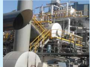
图 2：位于澳大利必和必拓公司（BHP Billiton）West Cliff Colliery 煤矿的 VAM 发电厂

在过去的五年里，利用热流量反向反应器（TFRR）技术的 VAM 项目已在澳大利亚、中国和美国得到商用开发。位于澳大利亚新南威尔士州必和必拓公司（BHP Billiton）West Cliff Colliery 煤矿的 VAM 项目是世界上首个从事 VAM 加工和发电的商用规模示范项目。氧化 0.9% VAM 所释放的能量可生成按设计适合传统汽轮机使用的高标号蒸汽。该项目于 2007 年投产，采用的是 MEGTEC Systems VOCSIDIZER™ 技术。该项目每小时可处理 250,000 立方米（m 3 ）的乏风，而且可利用废热汽轮机产生约 5 兆瓦（MW）的电和 625,000 个以上碳额度。MEGTEC Systems，作为全球甲烷行动（GMI）项目网络的成员，估计该系统已达到 95% 到 98% 的额定换热效率。如图 2 所示，VAM 处理风扇从 evasee 中抽采乏风并将其推送通过 TFRR。另外，图中还显示了蒸汽的循环过程和汽轮机的工作舱。